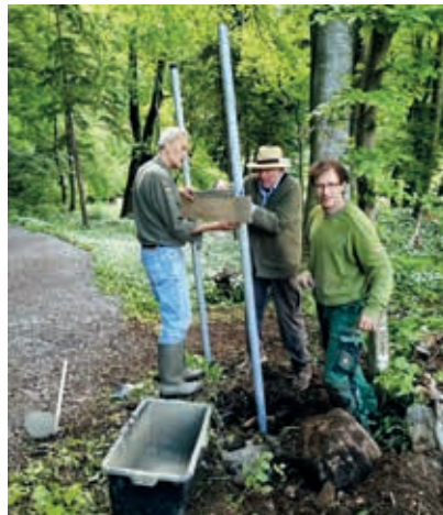
Befestigung der Tafel

Wie schon berichtet, haben wir im Herbst 2020 den Platz mit einigen Vereinsmitgliedern vorbereitet. Danke für die Unterstützung durch Seppi Maurer, Entsorgung des Holzabfalls und der Firma Wieser für die Baggerarbeiten. Während des