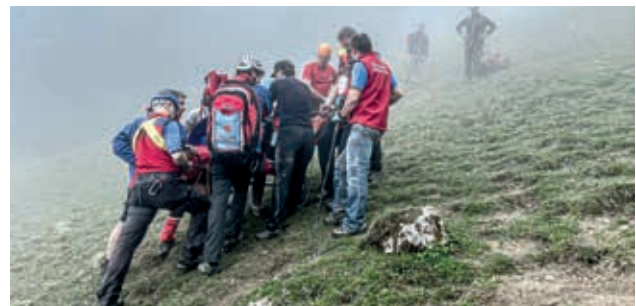
Einsatz am Heuberg

Der vom Einsatzleiter der Bergwacht Brannenburg unmittelbar zur Unterstützung angeforderte Rettungshubschrauber aus Traunstein konnte die Unfallstelle wegen dichter Wolken zunächst nicht anfliegen. Parallel stiegen zahlreiche Einsatzkräfte der Bergwacht zusammen mit zwei Bergwacht-Notärzten zu Fuß zur Einsatzstelle auf und versorgten die lebensgefährlich verletzte Patientin, die durch die anwesenden Ersthelfer bereits hervorragend betreut wurde.