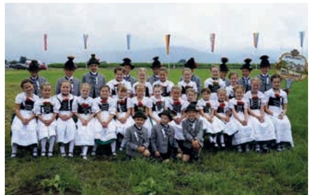
Kindergruppe beim Gaufest Pang

Die Festmesse zu Fronleichnam am Sonntag, den 06.06.2021 konnte im Freien im Waldpark stattfinden. Unsere Vereinsmitglieder und die Fahnenabordnung nahmen, soweit möglich in Tracht daran teil. Schön war es unser Gwand an Mann und Frau zu sehen, nicht nur im Kleiderschrank.