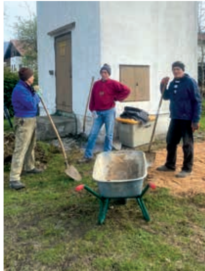
Anlegen der Blühwiesen

Auf der Festwiese wurden von der Gemeinde 4 Obstbäume gepflanzt. Hier übernimmt der Obst- und Gartenbauverein die Beschilderung der Bäume.