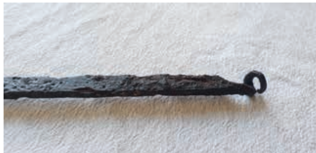
Bohrlochkratzer