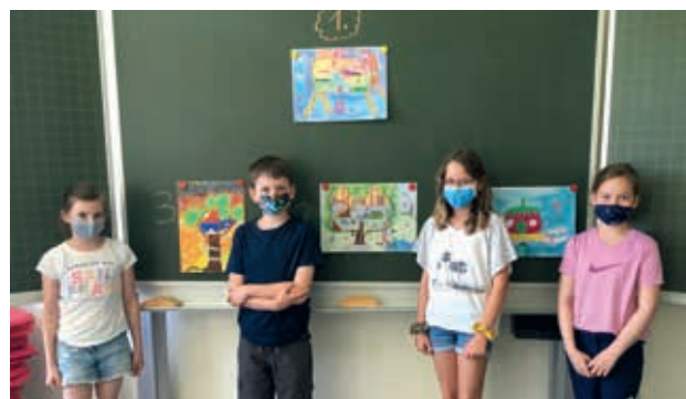
Gewinner aus der 4. Klasse

Unter dem Motto „Bau dir deine Welt“ fand in diesem Jahr der Malwettbewerb der „Meine Volksbank Raiffeisenbank eG Rosenheim“ statt. Coronabedingt konnte die Siegerehrung im kleinen Rahmen in den einzelnen Klassenzimmern mit Frau Daniela Baumgartner und der Lehrkraft vorgenommen werden. Mit kleinen Preisen wurden die Sieger beschenkt. Die Bilder können von außen an der Schulturnhalle besichtigt werden.