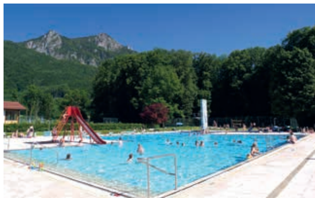
Freibad "Nussi" in traumhafter Kulisse

Unser Freibad lockt wieder mit angenehm temperiertem Wasser. Die niedrigen Inzidenzwerte ermöglichen wieder Freizeitvergnügen auf der großzügigen Liegewiese und den Badeanlagen.