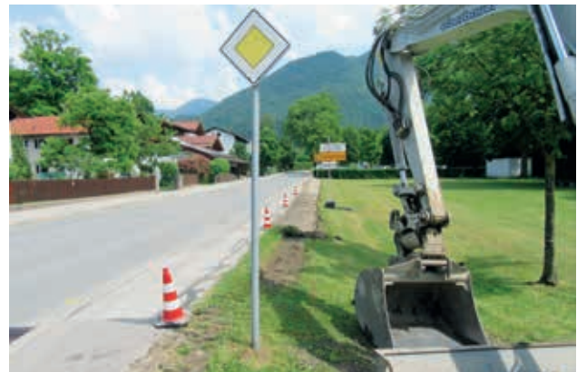
Blühwiesen an der Neubeuerer Straße

Alle Mitbürger sind aufgerufen die Initiativen zu fördern und selbst einen Beitrag für Biodiversität und den Erhalt natürlicher Lebensräume beizutragen.