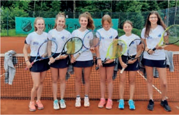
Jugendmannschaft mit ihren neuen Shirts