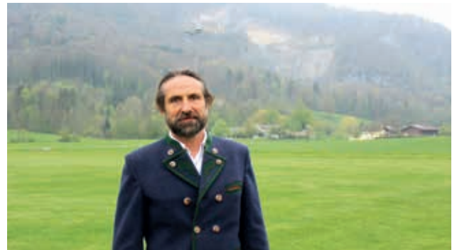
Prominenter Redner: Bergsteiger Alexander Huber

Der wohl prominenteste Redner bei der Veranstaltung war Bergsteigeridol Alexander Huber, der sich für den Erhalt der Bergwelt einsetzt. „Ihr habt in Nussdorf einen schönen Hausberg der es wert ist,