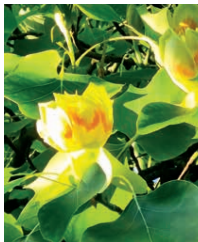
Suche nach dem Tulpenbaum